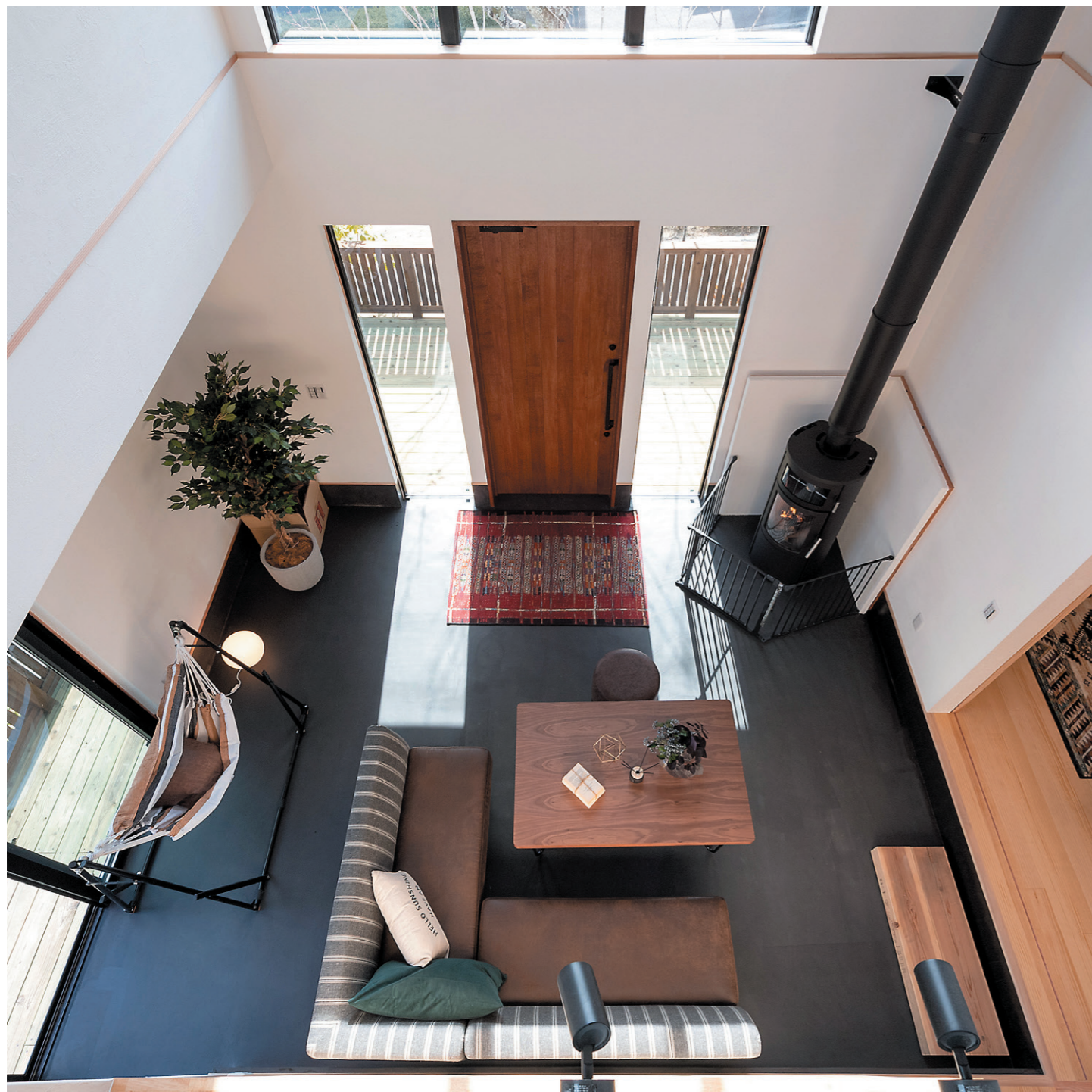
BRIC あすかの北 自然素材の家